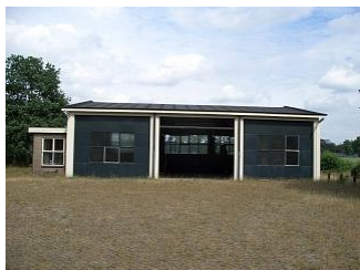
foto) Deze ruimte van circa 220m 2 gaan we hoofdzakelijk gebruiken als stallingruimte (busjes e.d.) en als buffer bij grote zendingen. Op circa 100 meter van dit gebouw bevindt zich ons tweede gebouw (zie foto). Dit is een voormalige sporthal van circa 500m 2 , 6 meter hoog, met een aantal kantoorrouiten er aan vast-

De toegang tot het terrein aan de Koningsweg (zie foto) willen wij gaan regelen met een op afstand bedienbare toegangspoort (kosten circa €3000, sponsor gezocht!)