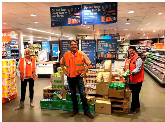
Een inzamelingsactie bij de supermarkt.

Overname van artikelen in andere publicaties is toegestaan. Vermelding van de bron wordt daarbij op prijs gesteld.