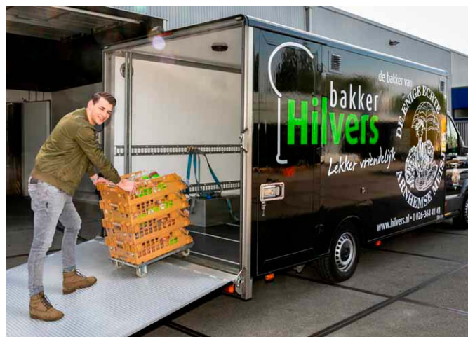
Bakkerij Hilvers verzorgde maandenlang een deel van de distributie van de pakketten naar de verder weg gelegen uitgiftepunten.

Onze klanten krijgen wekelijks minimaal 25-30 producten mee naar huis, met een minimale waarde van € 43,-. Naar schatting redden de voedselbanken daarmee 1,5% van het voedsel dat anders verspild zou worden.