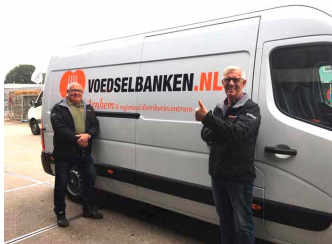
Eén van de twee nieuw aangeschafte wagens met de trotse transportmannen.

In 2020 zijn er 2 nieuwe wagens gekomen. Een Renault Master koelvries bus en een Renault Master bakwagen. Begin 2021 krijgen we 2 mooie Volvo koelvries-vrachtwagens.