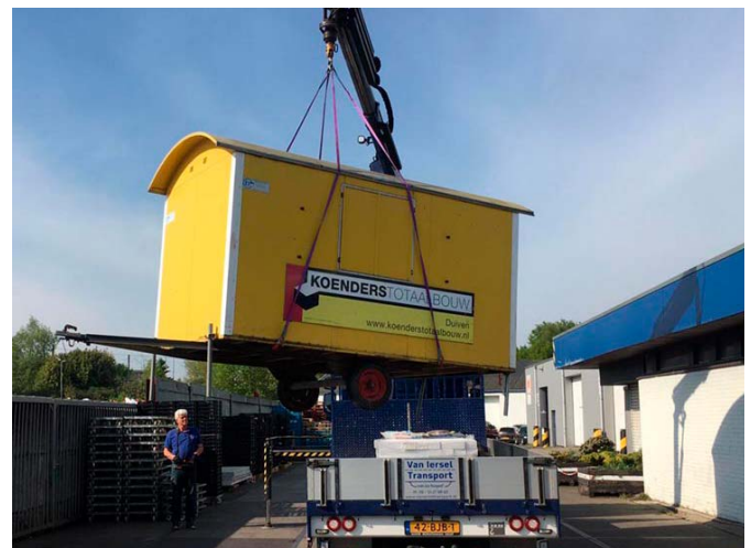
Bouwbedrijf Koenders stelde een Pipowagen ter beschikking, zodat de aanmelding van de klanten niet in regen of felle zonneshijn plaatsvond.