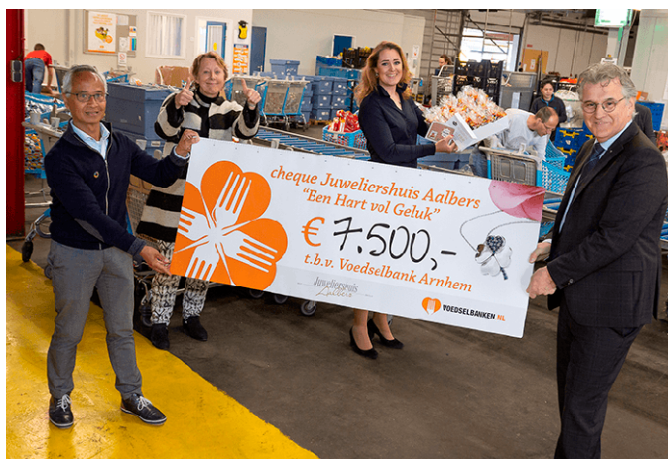
Een zeer geslaagde sponsoractie van Aalbers juweliers, die maar liefst tweemaal een grote donatie opleverde.