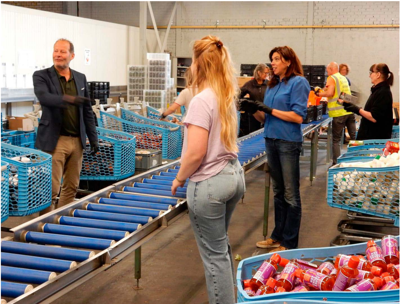
Ambassadeur van Voedselbanken Nederland Danny Blind kwam een kijkje nemen in ons Distributiecentrum en hielp ook een handje mee.

werkwijze. We moesten afscheid nemen van twee overleden vrijwilligers in deze coronatijd.