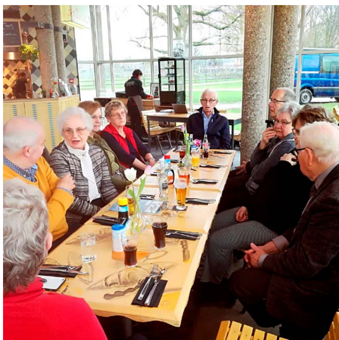
Afscheid vrijwilligers uitgiftepunt Honigkamp Presikhaaf.