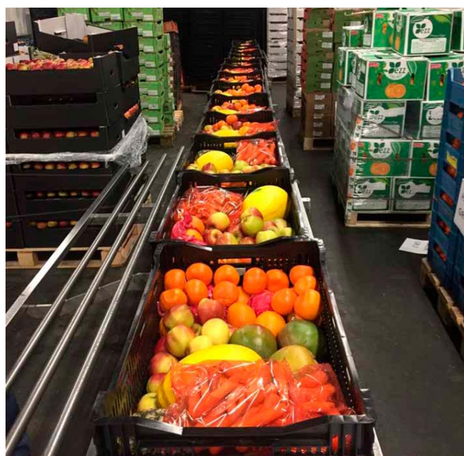
Eerste klas groente en fruit voor onze klanten.

Vanaf 21 maart kregen we direct veel producten aangeboden van restaurants, bars, sportclubs, niet veel later gevolgd door de groothandels Sligro, Bidfood en Hanos en anderen, waar vooral de koelversproducten op tientallen pallets werden aangevoerd. Daarna waren de toeleverende bedrijven aan de beurt die hun producten niet meer tijdig afgezet kregen. Schoolfruit en fruit op het werk vonden de Voedselbanken als oplossing voor hun niet af te zetten voorraden. We ontvingen op een bepaald moment in Arnhem 80 pallets met eerste klas fruit en snoepgroenten. Door onvoorspelbaar gedrag ging er ook veel mis in de planning bij supermarkten waardoor ook die toevoer flink toenam. Doordat we bij Voedselbank Arnhem besloten elke dag uit te gaan geven op de Bruningweg konden we de enorme toename van koelvers goed verwerken. Alhoewel onze klanten hierdoor soms met (te) veel producten naar huis gingen. Gelukkig waren de 25 bij ons distributiecentrum aangesloten lokale voedselbanken in Gelderland en Oost-Utrecht zeer bereid op meerdere momenten per week bij ons extra producten op te komen halen zodat iedereen mee kon profiteren van het enorme aanbod.