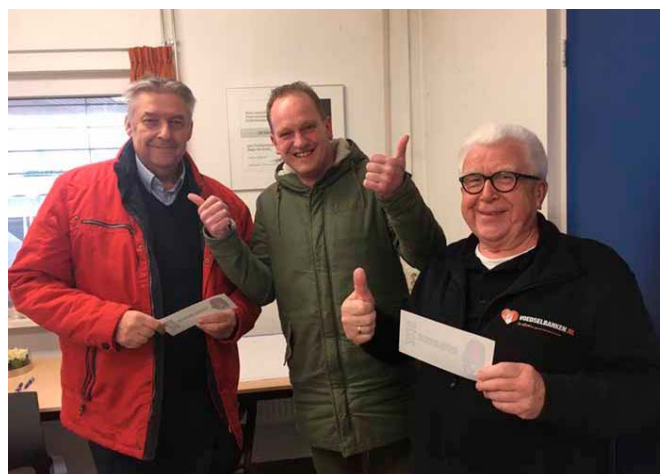
De trotse coördinatoren voedselveiligheid en uitgifte met de externe auditor in hun midden.

centrum is de maximale score van 100 punten behaald en voor de uitgiftepunten en onze winkel is een score van 95 behaald. Onze inspanningen op het terrein van voedselveiligheid gedurende het jaar 2020 maken bovendien dat we de audit in 2021 met vertrouwen tegemoet zien.