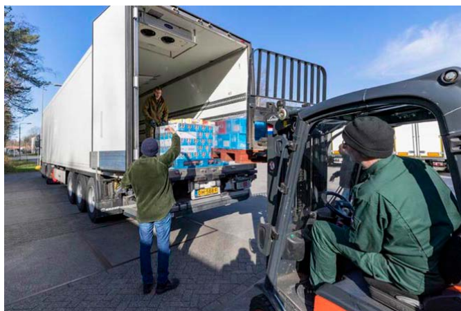
Inzet van Defensie in maart.

10 uitgiftepunten waren niet coronaproof in te richten. Hal 5 van het distributiecentrum werd elke dag omgebouwd tot een uitgiftepunt waar ruim 100 klanten hun pakket kwamen ophalen. Als gevolg van ruime media-aandacht melden zich 150 vrijwilligers aan om te helpen. We werden enorm geholpen door Het Rode Kruis, Defensie en Casino Holland uit Nijmegen. Ook de horeca, sportlocaties, theaterwereld en musea leverden ondersteuning.