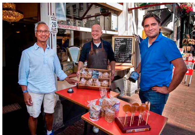
Een sponsoractie waarbij stroopwafels voor onze klanten gedoneerd werden.