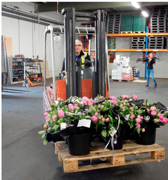
Bloemen van SIDN voor een aantal van onze vrijwilligers.

Sinds de eerste lockdown fungeert onze winkel in Arnhem-Zuid als normaal uitgiftepunt. Voor de coronatijd waren klanten een uur voor opening welkom in onze wachtruimte. Daarna gingen ze met een vrijwilliger door de winkel om een keuze uit de producten te maken. Door Corona moesten we het contact tussen klanten onderling én tussen vrijwilligers en klanten veel meer beperken. We hebben daarom besloten om in de winkel ook pakketten uit te geven zolang deze crisis voortduurt. Dit betekent dat de keuzemogelijkheid voor klanten (tijdelijk) gestopt is en dat pakketten aan de deur worden overhandigd aan de klanten. We hopen in de loop van 2021 weer onze rol als voedselbankwinkel te kunnen invullen.